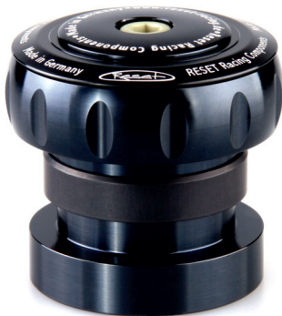
#1114-5 | KLEIN Quantum